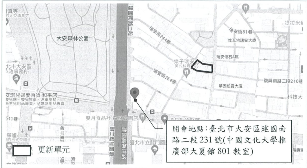
附件1 開會地點位置示意圖